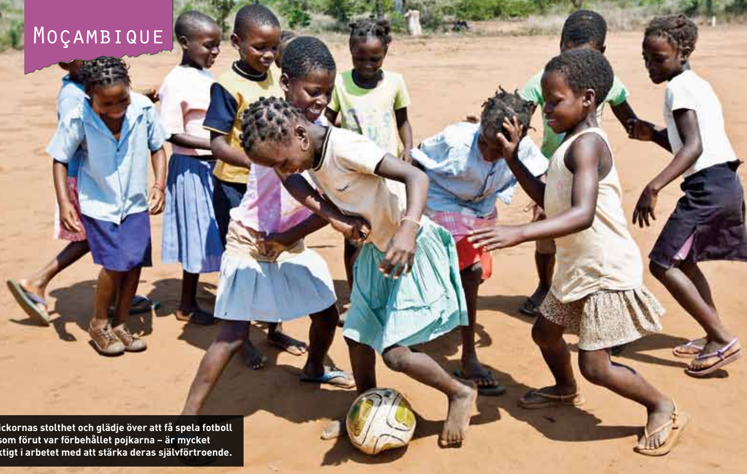
Flickornas stolthet och glädje över att få spela fotboll – som förut var förbehållet pojkarna – är mycket viktigt i arbetet med att stärka deras självförtroende.