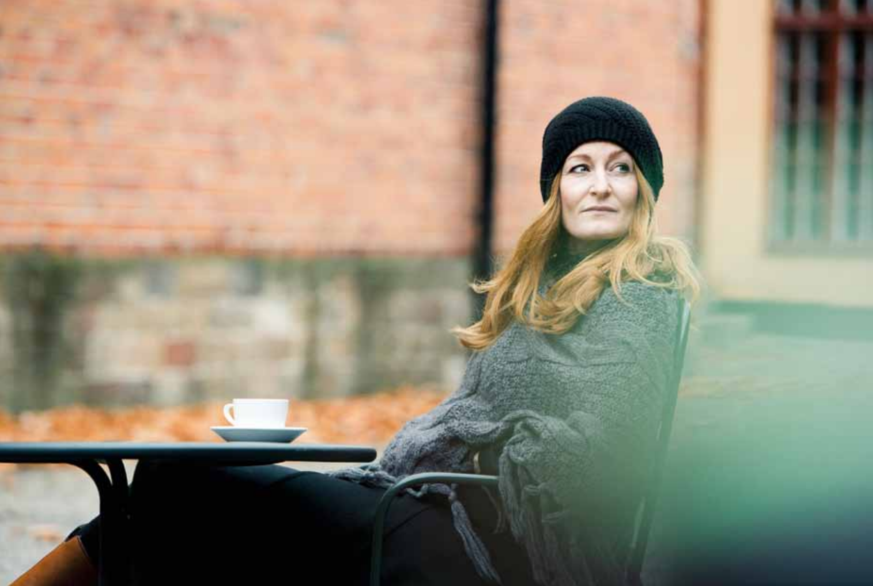
Annas texter är nära och berörande: "Man kan dö av att längta så som du gör nu. Jag vet. Jag har känt precis som du".