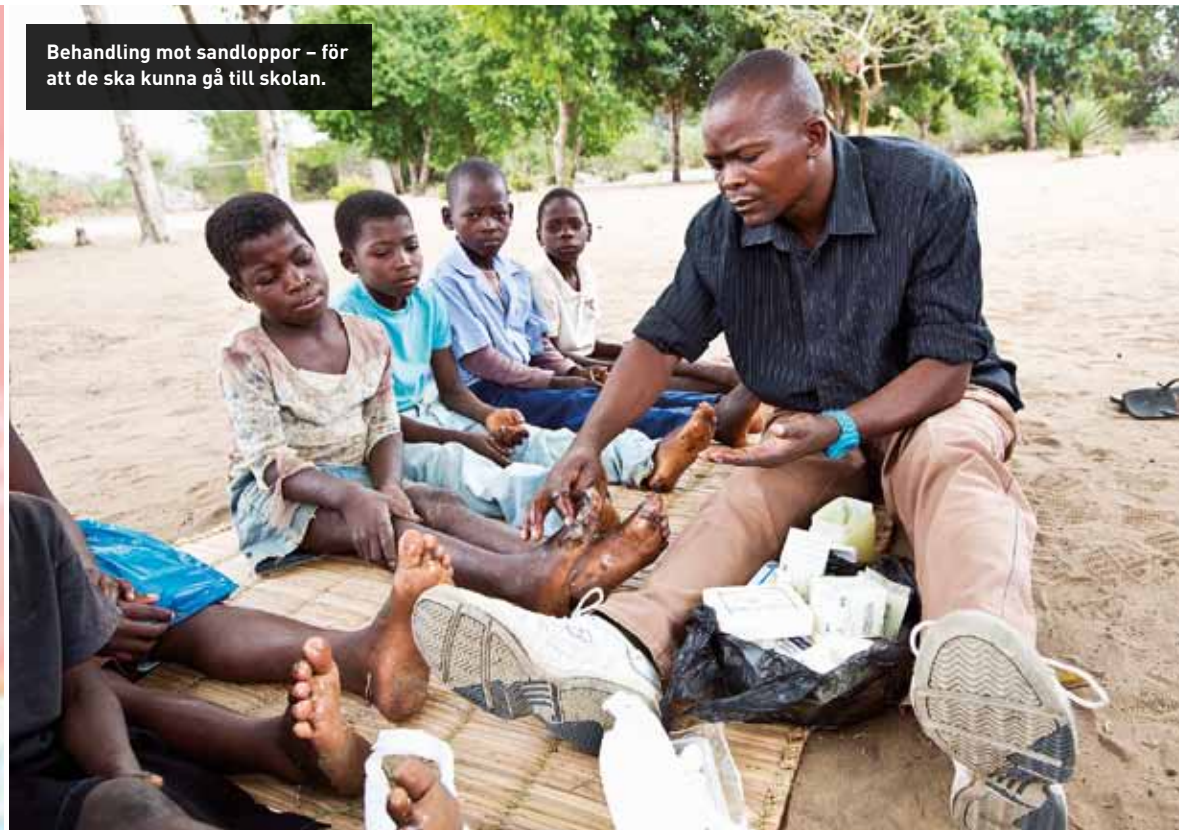
Behandling mot sandloppor – för att de ska kunna gå till skolan.

Alltför många afrikanska flickor slutar skolan i förtid, trots att de har bra läshuvud. Orsaker: De blir med barn, gifts bort eller tvingas ta hand om alla hushållssysslorna hemma.