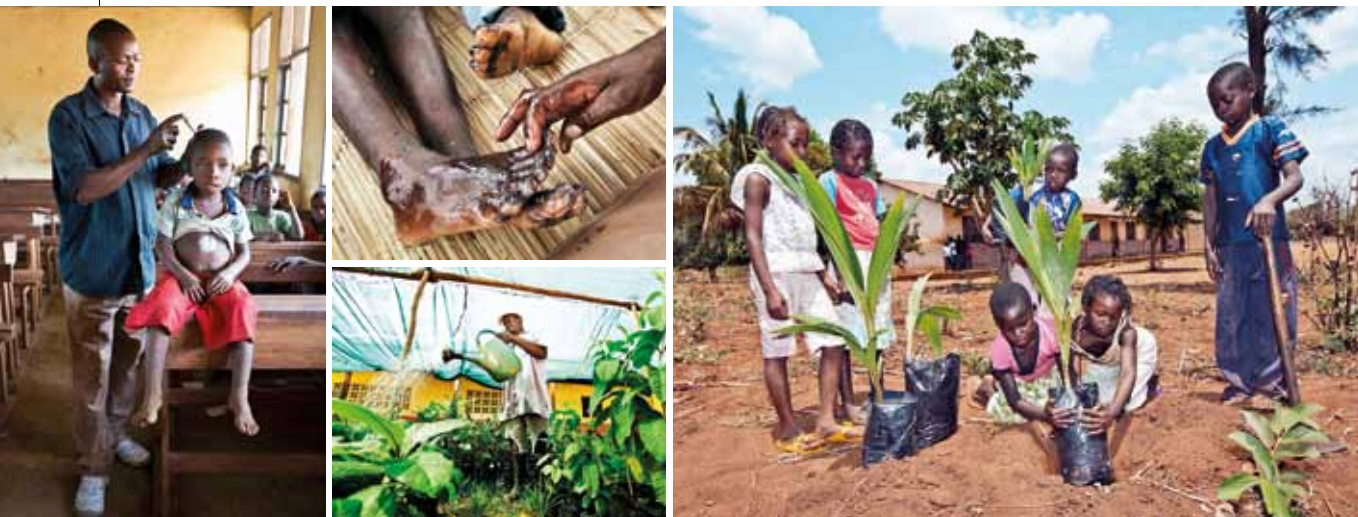
Hjälpen mot kliande parasiter och smärtsamma loppor ökar barnens närvaro i skolan. Medan odlingen av nyttiga växter ger dem både kunskap och mat – och gör dem bättre rustade att möta framtiden.

Ett stort TACK till alla sparare i Swedband Robur Humanfond som ger en del av sin avkastning till Läkarmissionen. På Hjärtedagen 14 februari får vi ta emot era pengar från 2012.